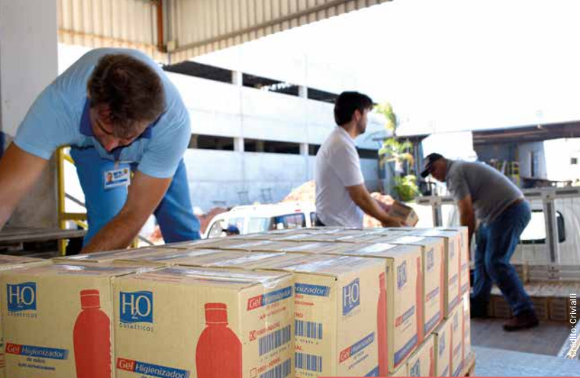
A Crivalli ampliou a produção de álcool em gel.