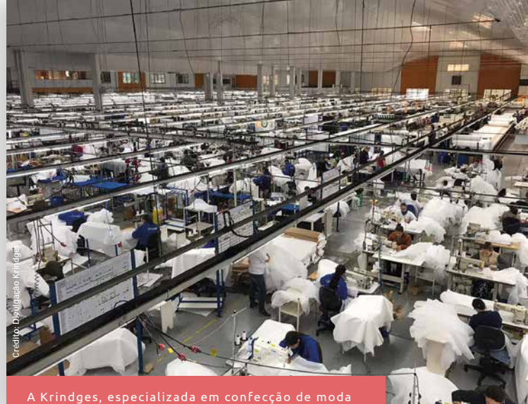
A Krindges, especializada em confecção de moda masculina, passou a fabricar aventais hospitalares.