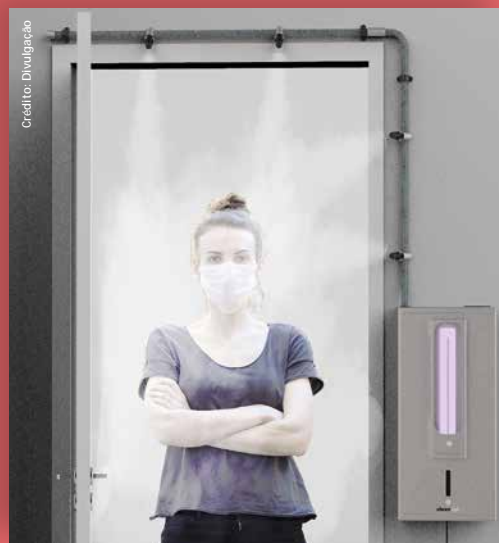
Unidade portátil de desinfecção emite gotículas de vapor de água com ozônio.

“Caso a pessoa deixe o celular em casa para ‘enganar’ o GPS, será detectado que a pulseira não está na área monitorada, registrando, assim, a violação da quarentena. E, caso saia com o smartphone, o GPS indicará que ela se afastou da área da quarentena”, explica o empresário. A True Work já tem experiência em monitoramento de pessoas com foco em Saúde e Segurança no Trabalho (SST), tendo realizado projetos com grandes empresas como Ocyan, Braskem e Mondelez, informa Fávaro.